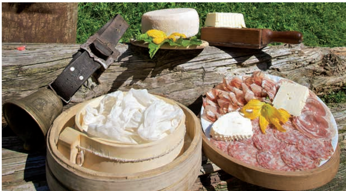
Prodotti tipici di montagna.

IGP nelle regioni italiane e un breve sunto di uno studio del Censis del 2013 sul turismo enogastronomico nelle province italiane ci possono mostrare come l'offerta gastronomica rappresenti un potenziale vantaggio comparativo (numero e tipo di risorse a disposizione) e diventare un punto di eccellenza attraverso il vantaggio competitivo (capacità di utilizzare le risorse in modo efficace ed efficiente) insieme all'interconnessione tra agricoltura, settore turistico e politiche regionali. A livello italiano, le regioni con una maggiore concentrazione di prodotti certificati sono le regioni del Nord e del Centro Nord. A primeggiare (in base al numero di prodotti e vini DOP e IGP) sono il Veneto, la Toscana, il Piemonte, Lombardia ed Emilia Romagna. Regioni montane come il Trentino-Alto Adige, la Valle D'Aosta e il Piemonte hanno però realtà completamente diverse fra loro. Troviamo, infatti, il Piemonte con i suoi 21 prodotti DOP e IGP all'ottavo posto nella classifica delle regioni italiane, il Trentino-Alto Adige con 15 prodotti (11 nella provincia di Trento e 4 nella provincia di Bolzano) all'undicesimo posto, e la Valle d'Aosta, con 4 prodotti al ventesimo posto. Per quanto riguarda invece i vini, il Piemonte conta 56 vini DOP (DOC e DOCG) posizionandosi al secondo posto dopo la Toscana, il Trentino-Alto Adige conta 10 DOP e 5 IGP (IGT 6 ) posizionando-