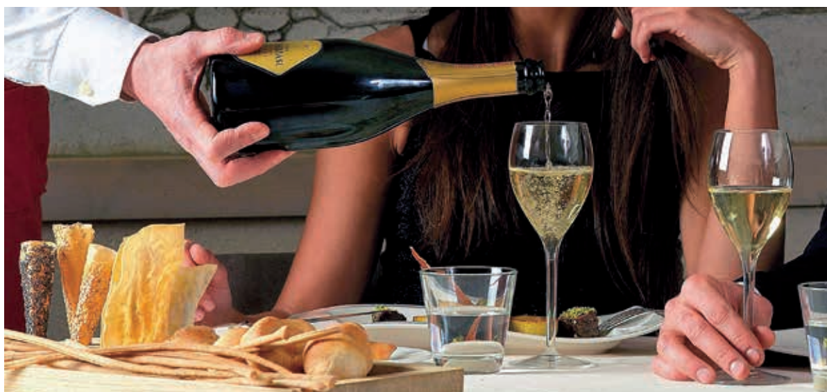
Mescita di Trentodoc, il metodo classico del Trentino.

a livello strettamente territoriale. Ma quali sono dunque le caratteristiche del turista enogastronomico? Quanto spende in cibi e bevande e, infine, quali sono le motivazioni che spingono il turista a compiere questo tipo di vacanza in Trentino-Alto Adige? L' identikit del turista enogastronomico si può tracciare grazie ai risultati di un'indagine svolta dall'Università di Bolzano all'interno del progetto STTOBS tra il 2013 e il 2014 con lo scopo di comprendere l'impatto economico e le caratteristiche del turista che frequenta gli agriturismi delle zone collinari altoatesine e le cantine del Trentino-Alto Adige. Dai dati emerge che più del 90% proviene da uno Stato estero. Su dieci intervistati sei erano uomini e quattro donne, con un'età media di circa 49 anni, nella maggior parte dei casi coniugati (88%). Circa il 30% degli intervistati possiede un titolo di studio elevato, ossia una laurea di primo livello, di secondo livello o un titolo postlaurea. La maggior parte (quasi la metà) svolge un lavoro da impiegato/a o da insegnante, seguiti da coloro i quali dichiarano di