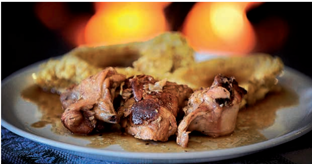
Polenta e coniglio, piatto tipico della gastronomia trentina.